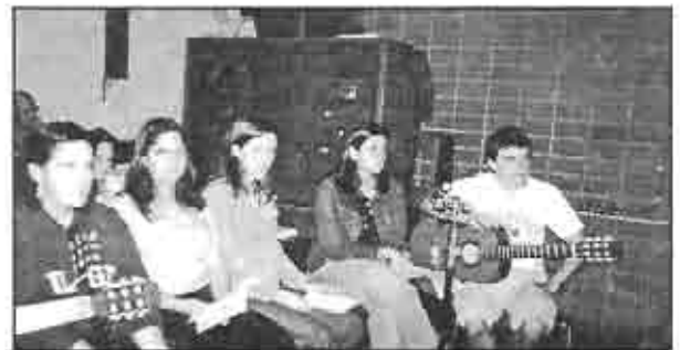
Culto Ecuménico en la Iglesia San Cayetano de Belgrano, 24 de abril