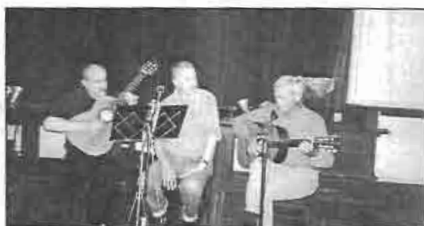
Trio "Rancho Aparte"

Fe de erratas: En la revista anterior se anunció el fallecimiento de Owen Farquharson y lamentamos que se escribió mal el apellido. Por lo tanto lo corregimos en esta nota y también confirmamos que falleció el 30 de enero y fue sepultado en el cementerio de la Iglesia de Mandisoví, Entre Ríos. Owen Farquharson era descendiente de los escoceses que fueron a Entre Ríos en el siglo XIX.