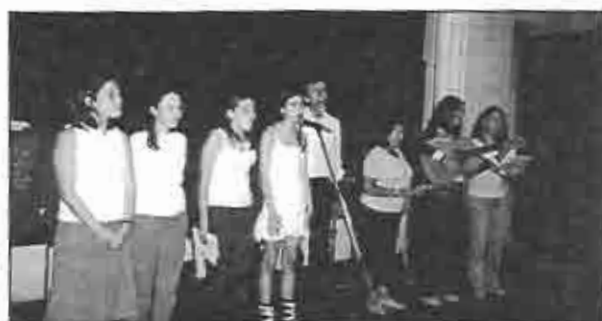
Coro de Témperley