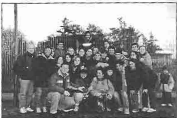
El grupo que visita el barrio, en la estación de Ardigó