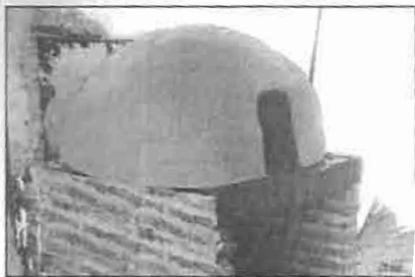
Horno de barro construido con la ayuda de los jóvenes